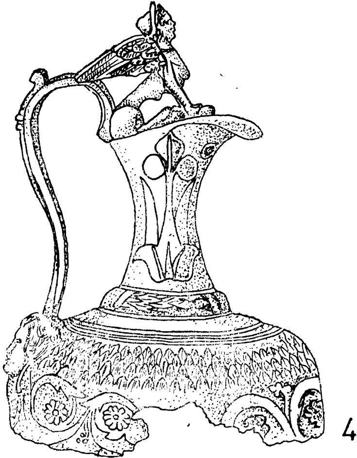
Fig. 2. 4. Cana de bronz de la Nagydorog (Ungaria), (după K. Szabo)