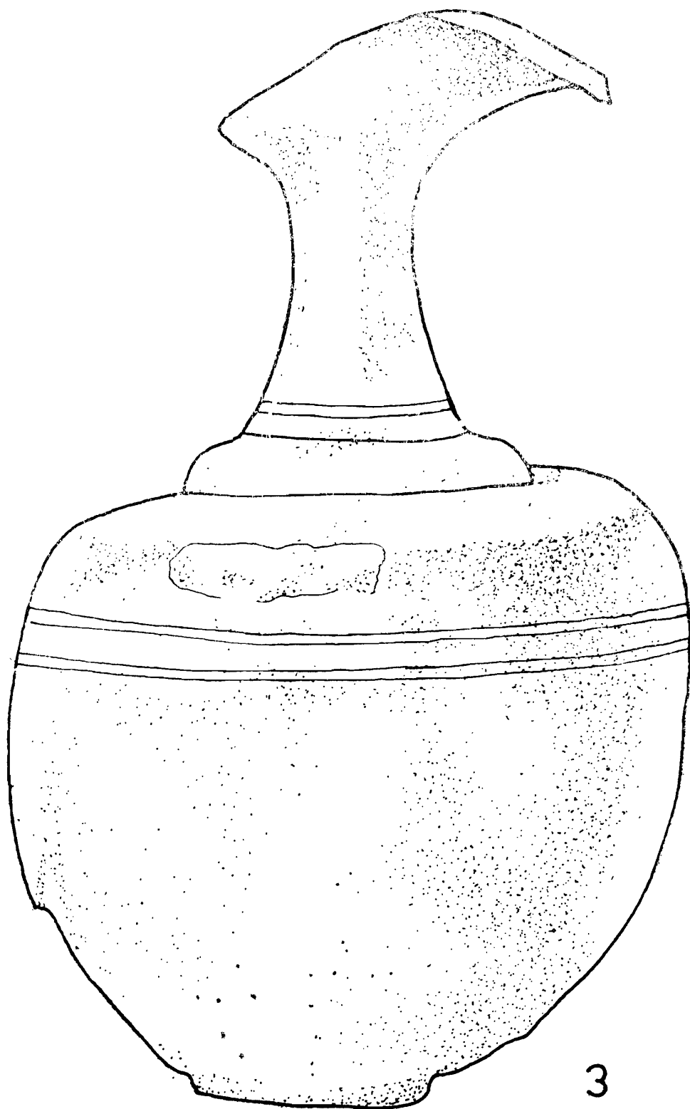
Fig. 2. 3. Cana de bronz de la Pusztasomodór (Ungaria), (după J. Hampel);